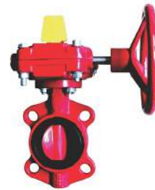
Wafer Butterfly Valve