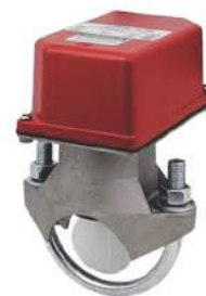
Water Flow Detector