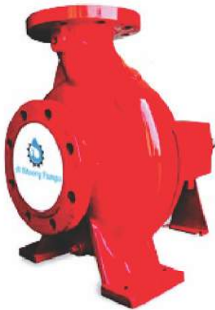
UL Listed End suction pumps