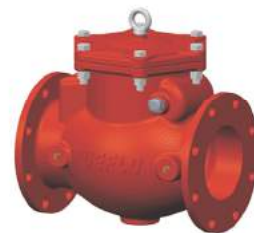
Swing Check Valve