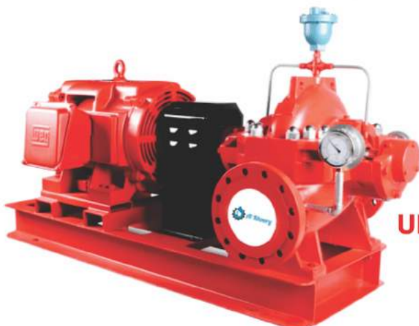
UL Listed and FM approved horizontal split case pumps