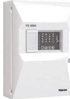
کنترل پنل متعارف ۲ زون - ۴ زون - ۶ زون - ۸ زون