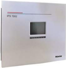
کنترل پنل آدرس پذیر ۱ لوپ - ۲ لوپ - ۴ لوپ

سیستم اعلام حریق متعارف سیستم اعلام حریق آدرس پذیر مورد تأیید سازمان آتشنشانی