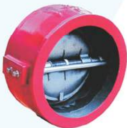
Double Door Check Valve