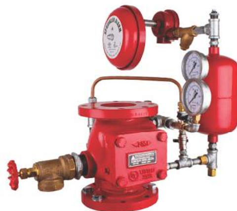
Wet Alarm Check Valve