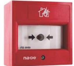
شستی اعلام حریق