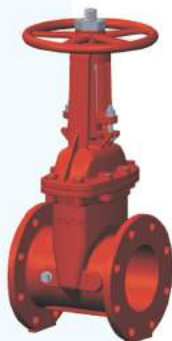
OS & Y Resilient Seated Gate Valve