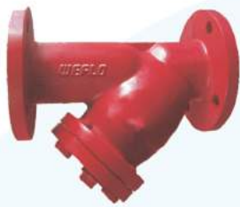
Y - Strainer