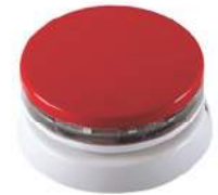
آزیر اعلام حریق